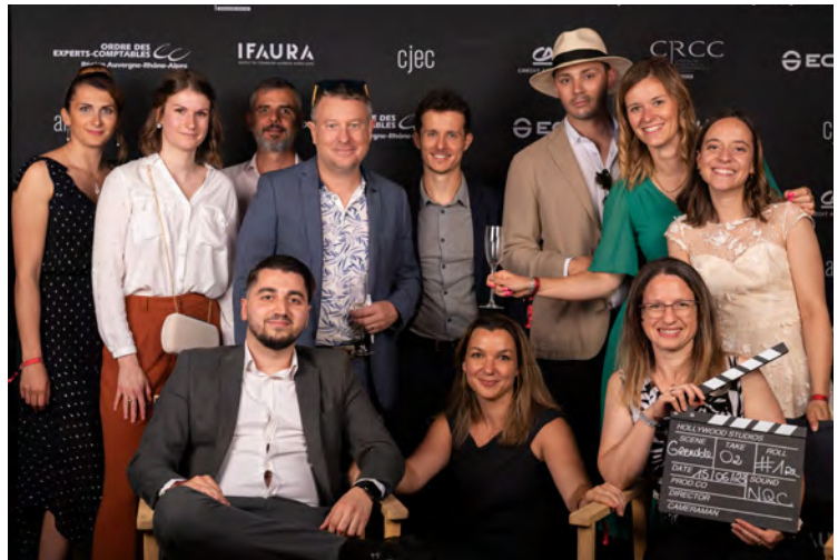
Tous les participants ont pu repartir avec une photo souvenir de cette soirée.