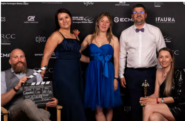
Carton plein pour le photocall !