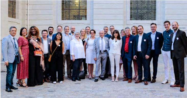
L'équipe de l'Ordre des experts-comptables.

La traditionnelle assemblée générale statutaire a eu lieu le 6 juillet 2023.