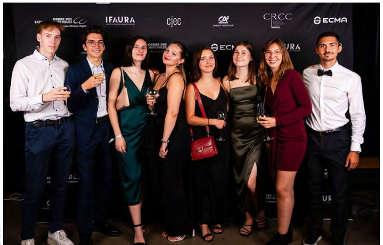
Tous les participants ont pu repartir avec une photo souvenir de cette soirée.